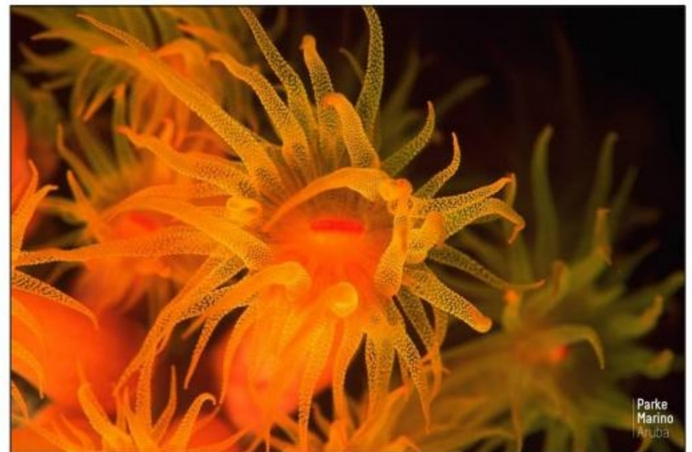
Parke Marino Aruba

cuida su mes, pues nos tur por traha den balansa cu ne. Pa es motibo tur organizacion, fundacion of comerciante cu ta haci uzo di e area